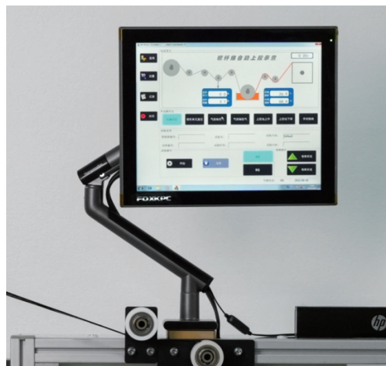
符合人体工学的工业触控电脑,操作简便